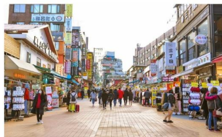
ย่านฮงแด