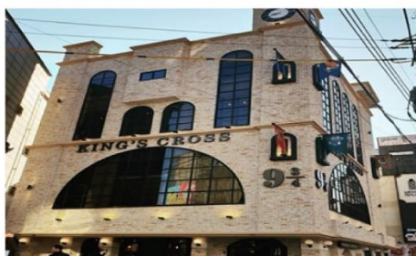
คาเฟ่แฮรี่พ็อตเตอร์