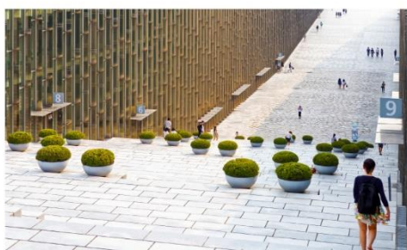
มหาวิทยาลัยอึววา