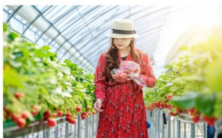
ฟาร์มสตรอว์เบอร์รี่ออร์แกนิก