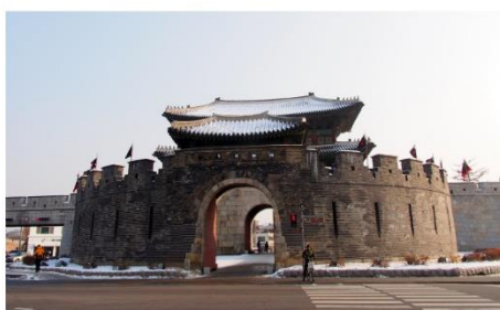
ป้อมปราการฮวาซอง