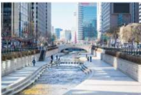
คลองชองกเยซอน