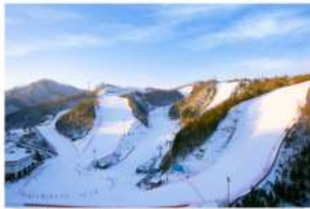
สกีรีสอร์ท กิจกรรมลานหิมะ