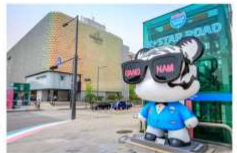
ช้อปปิ้งฮัพทงอง