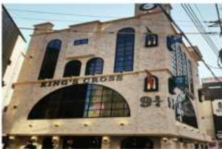
คาเฟ่แฮร์ฟอตเตอร์