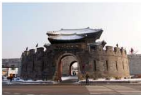
ป้อมปราการฮวาซอง