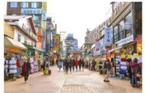
ย่านชงแด