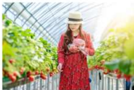
ฟาร์มสตรอว์เบอร์รี่ออร์แกนิก