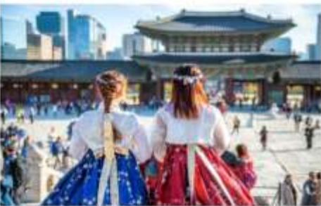
พระราชวังเคียงบก