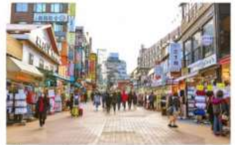
ย่านฮงแด