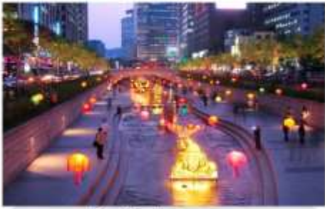
เทศกาลโคมไฟ