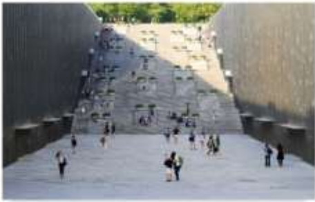
มหาวิทยาลัยฮิวา