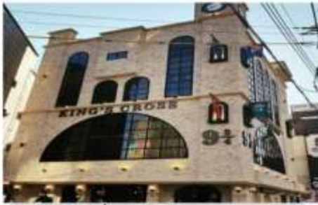
คาเฟ่แฮร์รี่พ็อตเตอร์