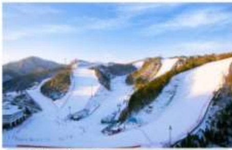
สกีรีสอร์ท กิจกรรมลานหิมะ