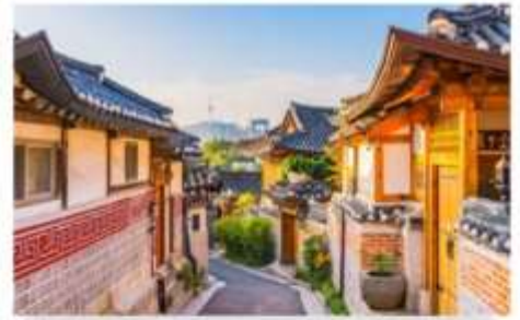
หมู่บ้านโบราณฮุกซอน