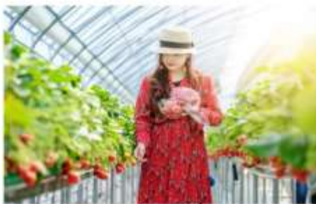
ฟาร์มสตรอว์เบอร์รี่ออร์แกนิก