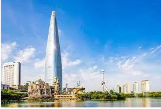
ลोटต์ โซล สกาย ทาวเวอร์