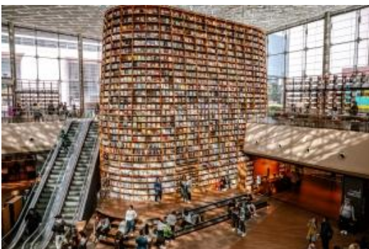
ห้องสมุด Starfield Library