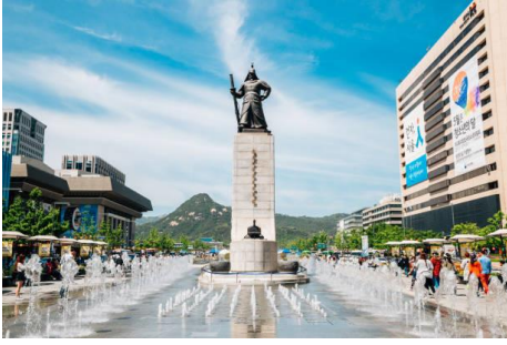
Gwanghwamun (จตุรัสควังฮวามุน)