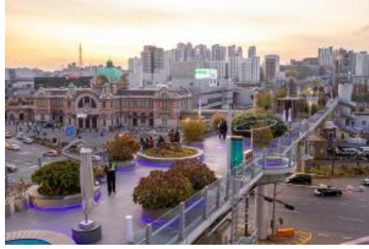
สวนลอยฟ้า Seoullo 7017