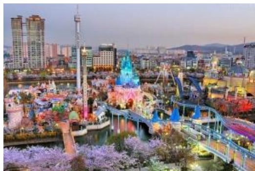
สวนสนุกล็อตเต้เวิลด์