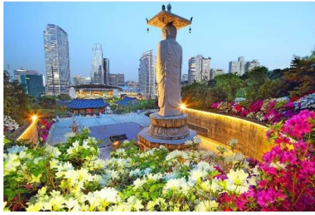
วัดพงอินซา