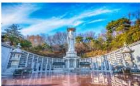
วัดพวงอินซา