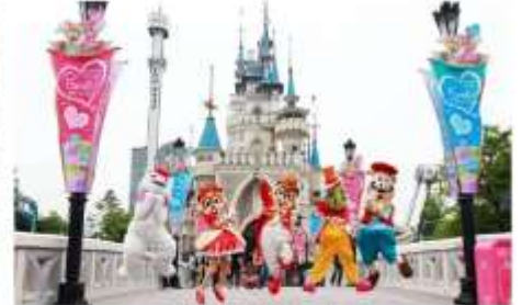
สวนสนุกล็อตเต้เวิลด์