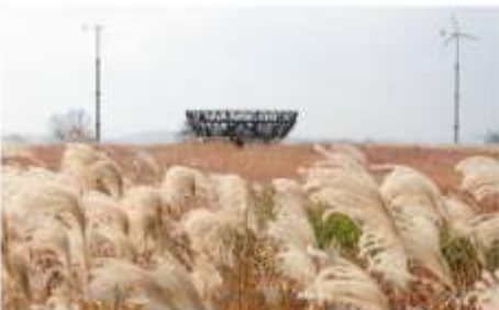
ฮานิลปาร์ค