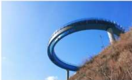
อารามารู สกายวอล์ค