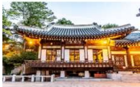
หมู่บ้านวัฒนธรรมนัมซานฮันอก