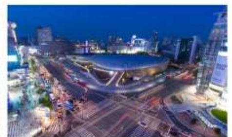
ทงแดมุน ดีไซน์พลาซ่า