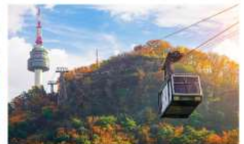
กระเช้าลอยฟ้า ณ โซลทาวเวอร์