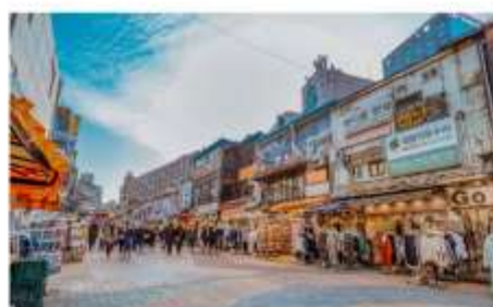
ย่านฮงแด