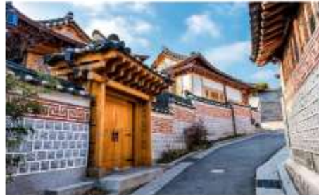
หมู่บ้านโบราณบุกซอน