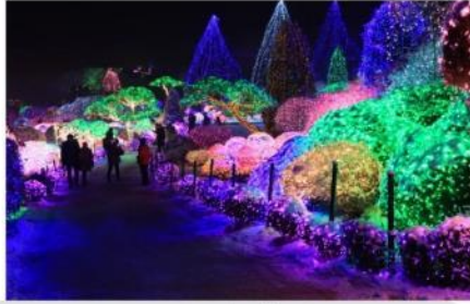
ชมเทศกาลประดับไฟฤดูหนาว