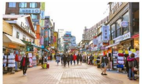
ย่านฮงแด