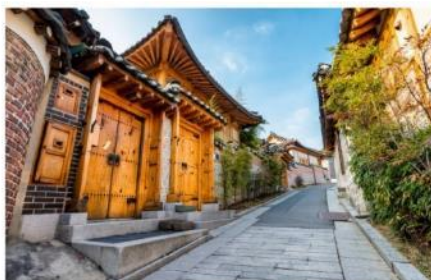
หมู่บ้านโบราณบุกชอน