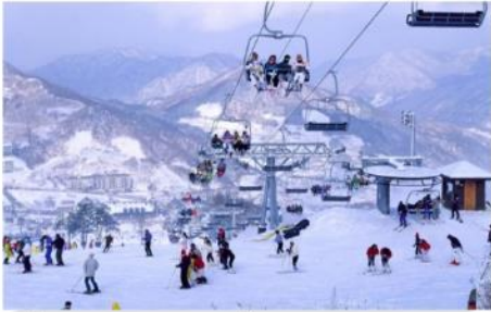
กิจกรรมลานสกี