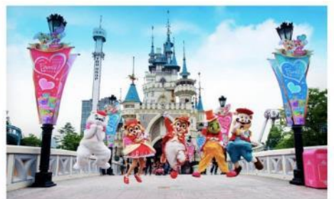
ลือตเต็วิลล์