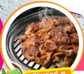
ฟินเวอร์ ๑