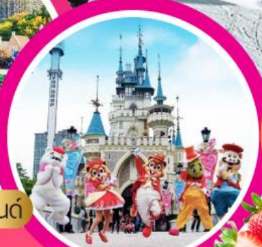
ลือตเตเวิลด์