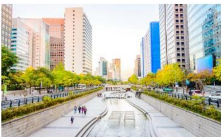
คลองชองเกซอน