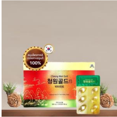
แข็งแรงขึ้นตามลำดับ

จากนั้นพาท่านไปรู้จักกับ สมุนไพรที่มีชื่อเสียงของประเทศเกาหลีใต้ Red Pine Oil หรือ น้ำมันสนเข็มแดง ตามตำหรับยาโบราณสมัยราชวงศ์โชซอน ที่ถูกบันทึกไว้เป็นลายลักษณ์อักษร ปัจจุบันได้นำมาสกัดด้วยวิธีที่ทันสมัยถึงสรรพคุณที่ดีที่สุดออกมาในรูปแบบที่ทานได้ง่าย และบำรุงสุขภาพได้ดีที่สุด น้ำมันสนเข็มแดงมีสรรพคุณช่วยในการทำความสะอาดระบบหลอดเลือด เคลียร์หลอดเลือดที่อุดตัน ลดคลอเลสเตอรอล ความดัน เบาหวาน ป้องกันเส้นเลือด ตีบ แดก ตัน อีกทั้งยังช่วยให้การผ่อนคลาย หลับสนิทมากขึ้น ผิวพรรณดูมีสุขภาพดี รับประทานเป็นประจำ ร่างกาย