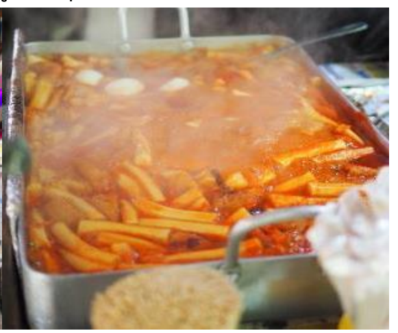
ค้า อิสระในการรับประทานอาหาร เพื่อความสะดวกในการท่องเที่ยว