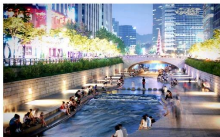
คลองชองเกซอน