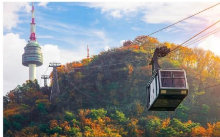
กระเช้าลอยฟ้า ณ โซลทาวเวอร์