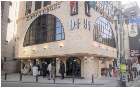
คาเฟ่แอร์รี่ พอดเตอร์