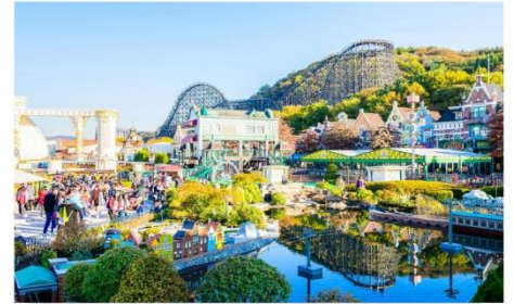
สวนสนุกเอเวอร์แลนด์