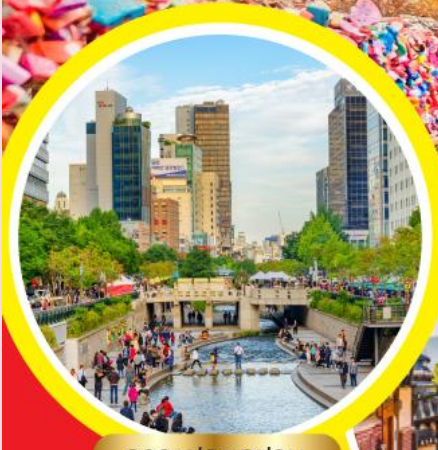
คลองชองเกซอน