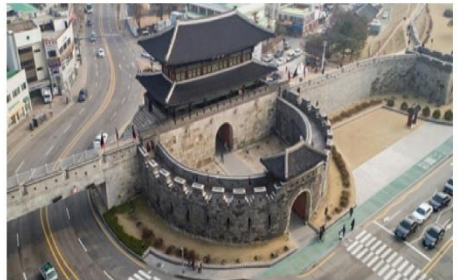
ป้อมปราการฮวาซอง