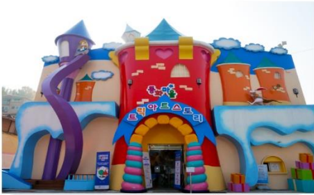
หมู่บ้านเทพนิยายช่องโวลดง