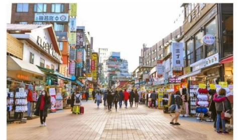
ย่านฮงแด