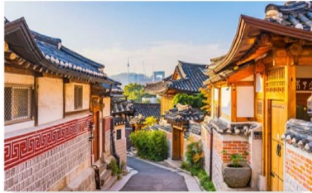
หมู่บ้านโบราณฮุกซอน