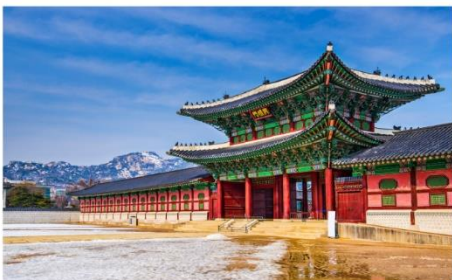
พระราชวังเคียงบก