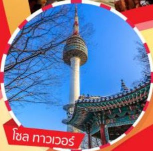
โซล ทาวเวอร์