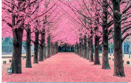
เกาะนามิ