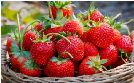
ฟาร์มสตอเบอร์รี่