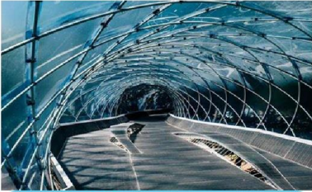
สวนศิลปะอันยาง