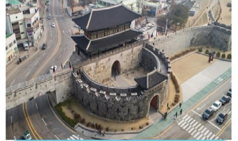
ป้อมปราการชวาซอง