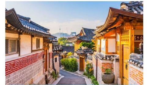
หมู่บ้านโบราณชุกซอน