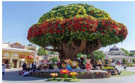
สวนสนุกเอเวอร์แลนด์