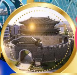
ป้อมปราการฮวาซอง