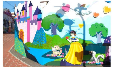
หมู่บ้านเทพนิยายชงไวลด์