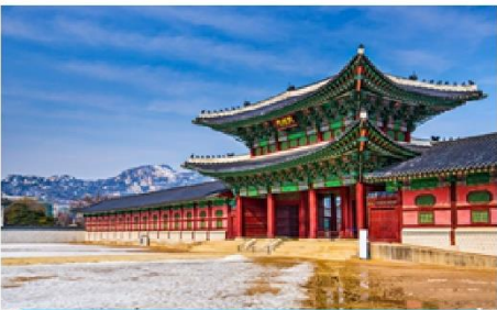
พระราชวังเคียงบ็อก