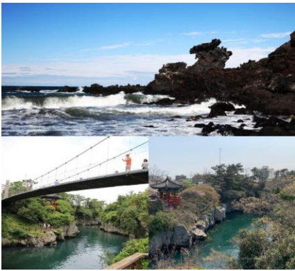
ทะเลที่มีสีสวยงามแปลกตาอีกด้วย

รับประทานอาหารเช้าที่โรงแรม อาหารเช้าของชาวเกาหลีประกอบไปด้วยข้าวสวย ข้าวต้ม ซุป ผักปรุงรสต่างๆ กิมจิ (ผักดองเกาหลี) ไข่กรอก และผลไม้ เป็นหลัก ในอดีตอาหารเช้าจะไม่แตกต่างจากอาหารมื้ออื่นๆมากนัก แต่จะต่างตรงที่จำนวนจาน (ใส่กับข้าว) ที่น้อยกว่าเท่านั้น แต่ในปัจจุบัน ผู้คนหันมารับประทานอาหารสไตล์ตะวันตกกันมากขึ้น