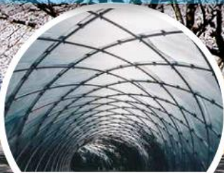
สวนศิลปะอันยาง