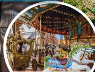
เฮอร์คิวลีส