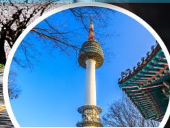
N SEOUL TOWER