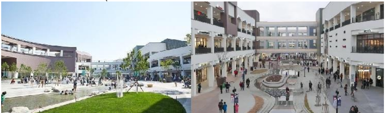
Hyundai Premium Outlet

จากนั้นนำท่าน ช้อปที่ Hyundai Premium Outlet เป็นเอาท์เล็ตขนาดใหญ่ของอาณาจักรฮุนได ร้านสินค้าแบรนด์เนมระดับโลกมากมาย หลายพันร้านค้า