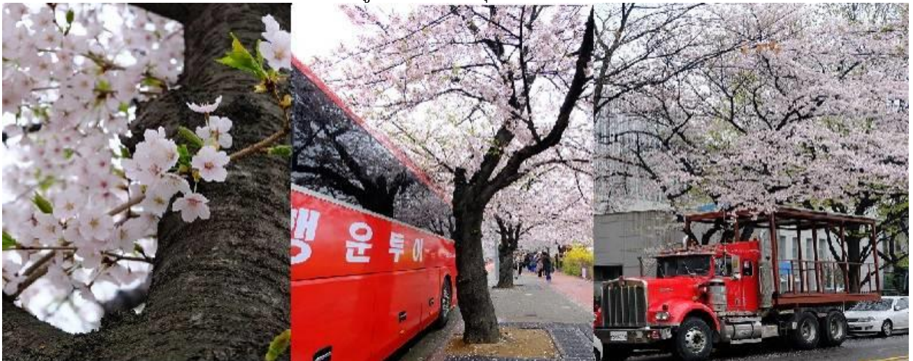
ชมดอกซากุระ ณ ถนนยอฮิดอ (Yeouido's Streets)

จากนั้นพาท่านชมดอกซากุระ หรืออีกชื่อหนึ่งเรียกว่าดอกเชอร์รี่ (Cherry Blossom) จะบานสะพรั่ง ทั่วถนนยอฮิดอ (Yeouido's Streets) ซึ่งมีต้นซากุระกว่า 1,400 ต้นในบริเวณนี้ ในเดือนเมษายนในแต่ละปี ประมาณกลางเดือน จะมีการจัดเทศกาลดอกซากุระ ณ ถนนสายนี้ ทุกท่านจะได้สัมผัสสีสันแห่งดอกซากุระ พร้อมถ่ายรูปเป็นที่ระลึกในบรรยากาศสุดโรแมนติก กับสีขาวอมชมพูของดอกซากุระที่สวยงาม