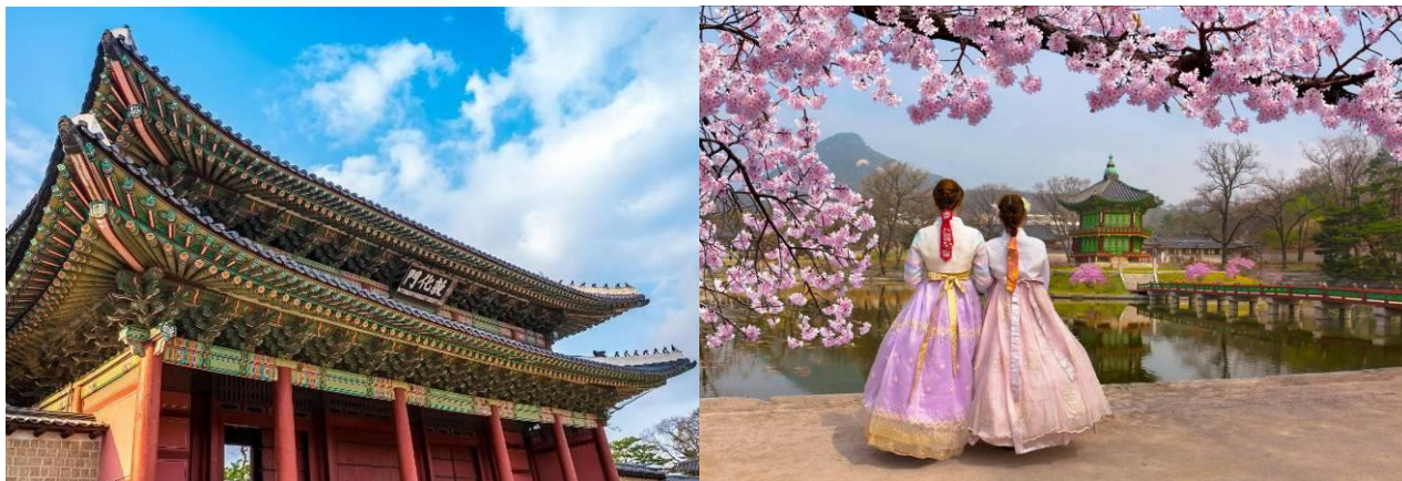
พระราชวังชางด็อกกุง + ใส่ชุดฮันบก

พาท่านชม น้ำมันสนเข็มแดง(Red Pine) ปัจจุบันนิยมมารับประทานเพื่อล้างพิษในร่างกาย ล้างไขมันในเส้นเลือดทั่วทั้งร่างกาย ป้องกันไขมันอุดตันในเส้นเลือด, โรคหัวใจ, โรคภูมิแพ้ เป็นต้น และยังให้ท่านได้ลองตรวจเส้นเลือดภายในร่างกายท่านฟรี อีกด้วย นำท่านสู่ ศูนย์สมุนไพรบำรุงต้นไม้อชันดา เจริญเติบโตในป่าลึกบนภูเขาที่ปราศจากมลภาวะและระดับสูงเหนือน้ำทะเล 50-800 เมตร ชาวเกาหลีรุ่นใหม่นิยมนำมารับประทานเพื่อช่วยดูแลตับให้สะอาดแข็งแรง ป้องกันโรคตับแข็งไม่ถูกทำลายจากการดื่มแอลกอฮอล์ กาแฟ บุหรี่ สารตกค้างจากอาหารและยา จากนั้นพาท่านไปชม พระราชวังชางด็อกกุง(Changdeokgung Palace) เป็นพระราชวังที่สร้างหลังจากพระราชวังเคียงบกกุง และเคยเป็นพระราชวังหลักของกษัตริย์หลายพระองค์ของราชวงศ์โชซอน ที่ได้รับการดูแลรักษาไว้อย่างดี ภายในประกอบด้วยพื้นที่สาธารณะ อาคารพระราชวังสำหรับราชวงศ์ และสวนบิวอน หรือรู้จักกันในนามสวนฮวอน สวนหย่อมด้านหลังที่เต็มไปด้วยต้นไม้อชันดาอายุกว่า 300 ปี บ่อน้ำและศาลาพักผ่อน มีความธรรมชาติมากที่สุดไว้เป็นที่พักผ่อน พิเศษสุด!! ให้ท่านได้ ใส่ชุดฮันบก (ชุดประจำชาติเกาหลี) ถ่ายรูปเก๋ๆ เดินเล่นบริเวณพระราชวัง