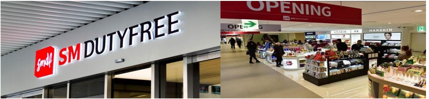
SM DUTY FREE

จากนั้นพาท่านชมดอกซากุระ หรืออีกชื่อหนึ่งเรียกว่าดอกเชอร์รี่ (Cherry Blossom) จะบานสะพรั่ง ทั่วถนนยอฮิดอ (Yeouido's Streets) ซึ่งมีต้นซากุระกว่า 1,400 ต้นในบริเวณนี้ ในเดือนเมษายนในแต่ละปี ประมาณกลางเดือน จะมีการจัดเทศกาลดอกซากุระ ณ ถนนสายนี้ ทุกท่านจะได้สัมผัสสีสันแห่งดอกซากุระ พร้อมถ่ายรูปเป็นที่ระลึกในบรรยากาศสุดโรแมนติก กับสีขาวอมชมพูของดอกซากุระที่สวยงาม