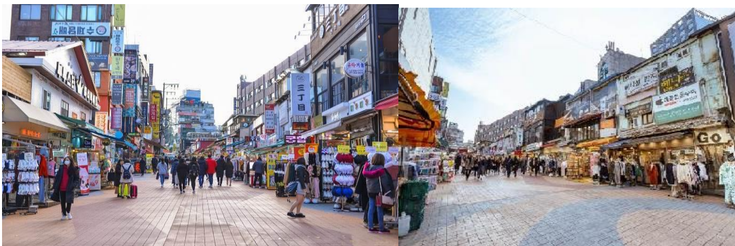
ตลาดองอิก

พาท่านเข้าชม ศูนย์โสม ซึ่งรัฐบาลรับรองคุณภาพว่าผลิตจากโสมที่มีอายุ 6 ปี ซึ่งถือว่าเป็นโสมที่มีคุณภาพดีที่สุดในขบวนการชีวิตของโสม พร้อมให้ท่านได้เลือกซื้อโสมที่มีคุณภาพดีที่สุดในราคาถูก กว่าไทยถึง 2 เท่า กลับไปบำรุงร่างกายหรือฝากญาติผู้ใหญ่ที่ท่านรักและนับถือ จากนั้นพาท่านอัพเดทเทรนแฟชั่นของวัยรุ่นเกาหลี ณ ตลาดสุดฮิป ตลาดองอิก แหล่งช้อปปิ้งที่อยู่ล้อมรอบไปด้วยมหาวิทยาลัยชื่อดังในเกาหลี สินค้าในย่านนี้ ส่วนใหญ่เป็นสินค้าวัยรุ่นที่ทันสมัยและราคาไม่แพงที่ออกแบบโดยดีไซเนอร์เกาหลีรองเท้ากระเป๋าเครื่องประดับเครื่องสำอาง และยังมีร้านแบรนด์เนมอยู่ทั่วไป เช่น EVISU, ZARA ทุกวันเสาร์ลานหน้าประตูของมหาวิทยาลัยองอิก จะมีผลงาน ศิลปะในรูปแบบต่างๆเช่น เครื่องประดับ ตุ๊กตา เสื้อผ้า และของแฮนด์เมดที่น่ารักและใช้ความคิดสร้างสรรค์ของบางอย่างทำมาขึ้น เดียวเพื่อให้ได้เลือกซื้อบางที่อาจเป็นสินค้า ที่มีขึ้นเดียวในโลก