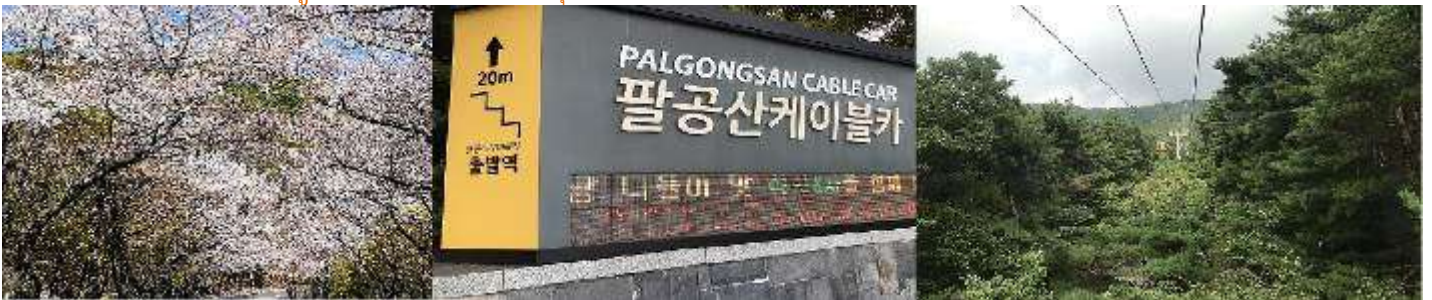
ภูเขาพัลกงซาน (Palgongsan)

จากนั้นพาท่านชม ภูเขาพัลกงซาน (Palgongsan) โดยระหว่างทางไปภูเขาพัลกงซานจะเต็มไปด้วยสีชมพูจากดอกพื้อดกุด หรือ ดอกซากุระ ที่บานสะพรั่งอยู่ตามแนวถนนให้เราได้แวะมาถ่ายรูปสวยๆกัน ในช่วงต้นเดือน - กลางเดือนเมษายนของทุกปี จะมีเทศกาล Palgongsan Cherry Blossom Festival มีกิจกรรมอยู่มากมาย เช่น การละเล่นพื้นเมืองของชาวเกาหลี โชว์ร้องเพลง และยังมีชุมชนขายของที่ระลึก ร้านค้าขายอาหารเพื่อสุขภาพต่างๆอีกมากมาย **หมายเหตุ : ดอกซากุระจะเริ่ม บานประมาณช่วงปลายเดือนมีนาคมถึงต้นเดือนเมษายน ทั้งนี้การบานของดอกซากุระขึ้นอยู่กับสภาพอากาศ แล้วพาท่าน ขึ้นเคเบิลคาร์ เพื่อชมวิวกาซามุมสูง ระหว่างทางท่านจะได้ชมวิวแบบ 360 องศา บนภูเขาจะมีจุดชมวิวให้ถ่ายรูป และมีร้านอาหาร ร้านกาแฟให้ท่านได้นั่งพักผ่อน หมายเหตุ : อากาศบนภูเขาจะเย็นกว่าปกติ กรุณาเตรียมเสื้อกันหนาวไปด้วยค่ะ