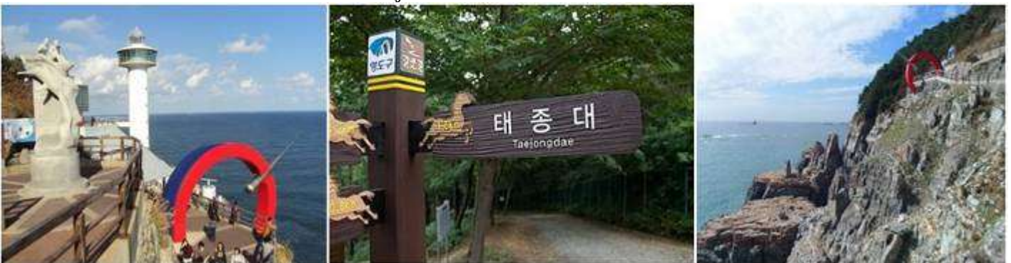
สวนแทงแด

จากนั้นพาท่านเข้าสู่ สวนแทงแด (Taejongdae Park) ตั้งอยู่ที่เกาะยงโด ทางตะวันตกเฉียงใต้ ของใจกลางเมือง สวนแทงแดตั้งชื่อตามกษัตริย์ของเกาหลีชื่อ TaeJong Mu-Yeol ที่ชอบเดินทางมาที่นี่เพื่อยิงธนู มีขนาดพื้นที่ประมาณ 1,100 ไร่ ประกอบไปด้วย ต้นไม้สีเขียวอย่างต้นสน ดอกไม้บานาชนิด และหน้าผาหิน จุดชมวิวสูงสุดมีความสูงที่ 250 เมตร โดยจะมีทางเดินรอบเกาะ จึงเป็นที่ออกกำลังกาย เดินเล่น กินลมชมวิว ปิกนิกของชาวเมืองปูซาน ภายในสวนแทงแด ประกอบไปด้วย Taejongsa Temple , Gumyeongsa Temple . ประภาคารยงโด(Yeongdo Lighthouse) เป็นจุดชมวิว ที่สูงที่สุดของสวนแห่งนี้, ลานชมวิว แทงแด(Taejongdae Observatory)เป็นอาคารรูปทรงกลมขนาดใหญ่ ที่เป็นจุดชมวิว ที่สวยงาม,หน้าผาหินและชายหาดที่เป็นหินกรวดที่เป็นสัญลักษณ์หนึ่งของสวนแห่งนี้ภายในสวนแทงแด จะมีการบริการ โดยรถนำเที่ยวของอุทยาน "Danubi Train" แวะจอดตามสถานี ให้ท่านได้ลงไปสัมผัสกับบรรยากาศ ความสวยงามของทะเล และหน้าผาสูงชัน เรียกว่ามาที่นี่ ที่เดียวก็อึ้งอัมความประทับใจไปทั้งวันเลยทีเดียว