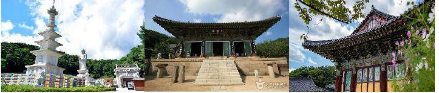
วัดดงฮาซา

เช้า หลังจากพิธีการตรวจคนเข้าเมืองและศุลกากรแล้ว ไกด์ท้องถิ่นคอยต้อนรับทุกท่าน จากนั้นพาท่านเดินทางไปยังเมืองแทกู เพื่อชม วัดดงฮาซา (Donghwas Temple) เป็นวัดเก่าแก่อายุกว่า 1,500 ปี สร้างในสมัยกษัตริย์โชจี แห่งอาณาจักรซิลลา ภายในมีอมิตาภะพุทธเจ้า และพระพุทธรูปหินพระศรีศากยมุนีอยู่ด้านนอก อีกหนึ่งไฮไลท์ก็คือ ยักษ์ชายอแรแดพลุ Yaksa-yeoraedaebul พระขนาดใหญ่ที่สร้างขึ้นเพื่อเป็นศูนย์รวมใจของผู้มาสวดมนต์ ทำบุญ มีความสูงถึง 17 เมตร นอกจากนี้ ยังมีหอคอยหิน โคมไฟหิน รูปปั้นสิงโต และดอกไม้ที่ประดับฐานพระพุทธรูป ด้านหลังพระพุทธรูป เป็นหมู่หินที่โอบรอบสวยงามมาก นับเป็นผลงานประติมากรรมหินระดับโลก