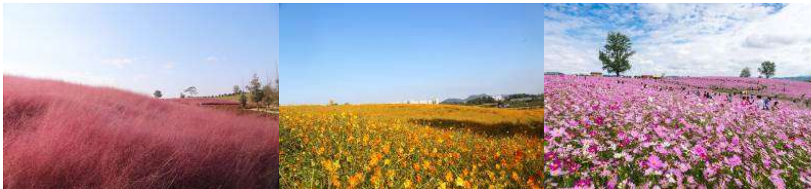
อันซองฟาร์มแลนด์