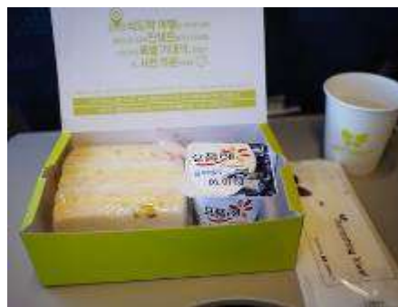
อาหารบนเครื่องบินจินแอร์ชาไป