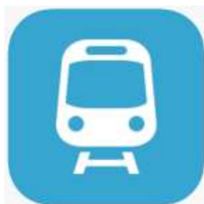
Subway Korea (สำหรับดูแผนที่รถไฟใต้ดิน)

อันดับที่สอง แนะนำให้โหลดแอปพลิเคชันเหล่านี้ลงมือถือเพื่อความง่ายในการเดินทาง เนื่องจาก Google map ไม่สามารถใช้งานได้อย่างมีประสิทธิภาพในเกาหลีใต้ เพราะเหตุผลด้านกฎหมายและความปลอดภัย ลูกค้าสามารถตั้งค่าเป็นภาษาอังกฤษได้ ใช้งานสะดวก