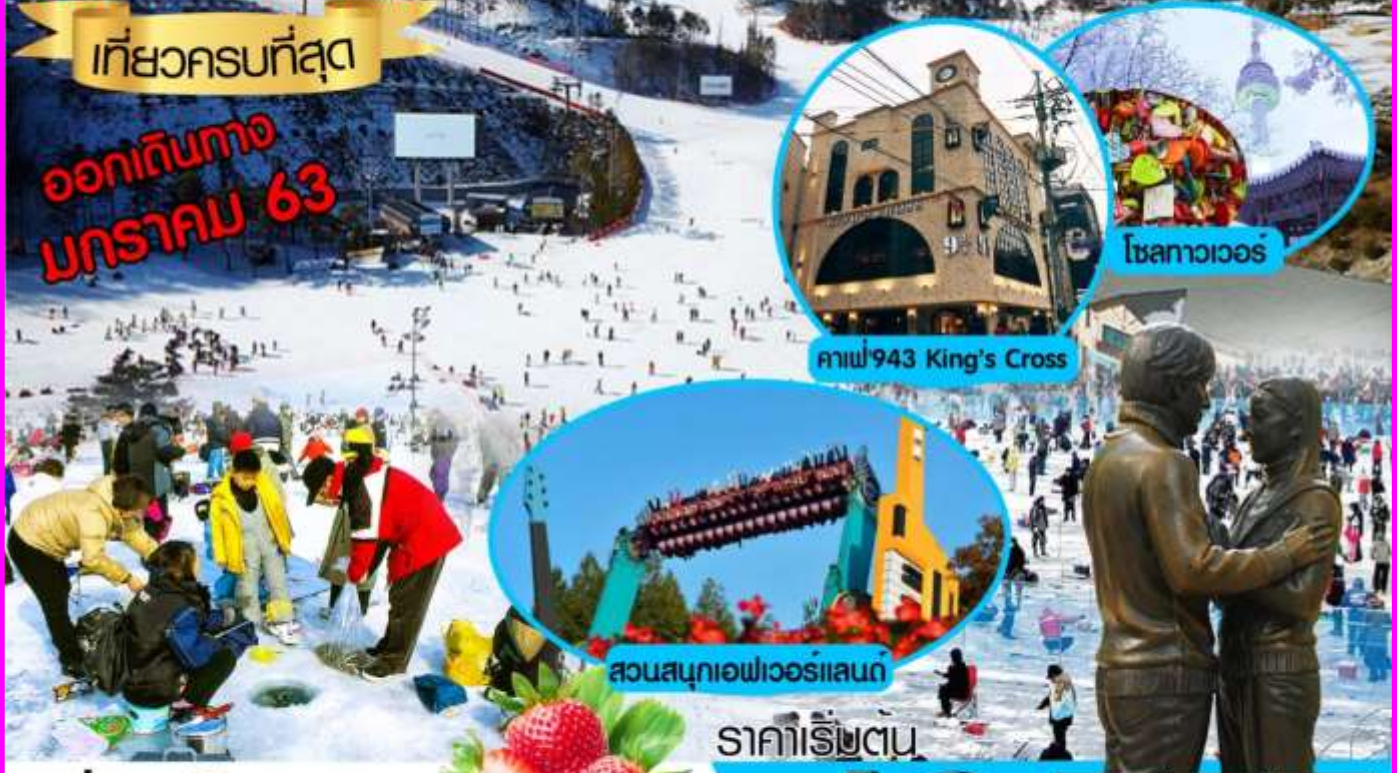
ภาพ 943 King's Cross