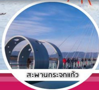
สะพานกระจกแก้ว