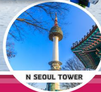
N SEOUL TOWER