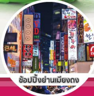
ช้อปปิ้งย่านเมียงดง