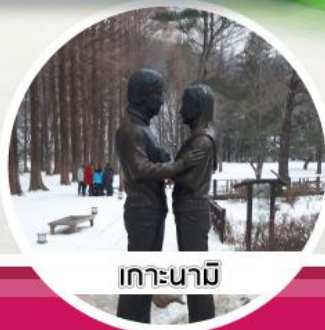
เกาะนามิ