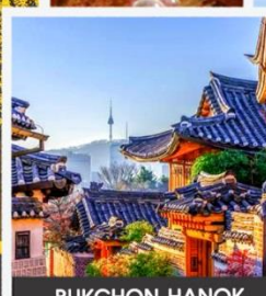
BUKCHON HANOK VILLAGE