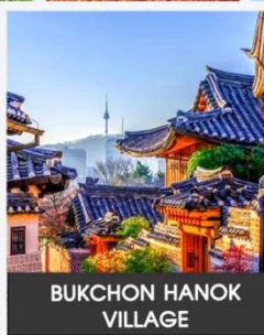
BUKCHON HANOK VILLAGE