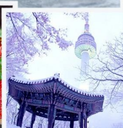
N Seoul Tower