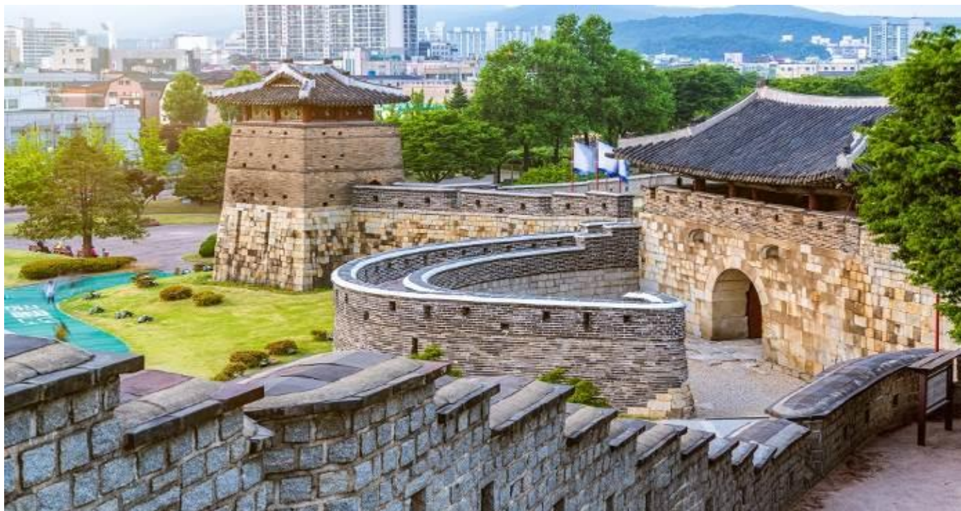
ป้อมฮาซอง

พาท่านเดินทางไปชม ป้อมฮาซอง(Hwaseong Fortress) ซึ่งเป็นสิ่งก่อสร้างขนาดใหญ่ตั้งแต่สร้างขึ้นช่วงปี ค.ศ.1794-1796 เป็นป้อมปราการประจำเขตชวอนของจังหวัดคยองกี เพื่อเป็นรากฐานสำหรับการสร้างเมืองใหม่ในบริเวณนี้กำแพงของป้อมปราการมีความยาวถึง 5.5 กิโลเมตร มีประตู 4 ประตูในแต่ละทิศและมีรูปแบบทางสถาปัตยกรรมที่ยิ่งใหญ่และงดงาม ป้อมฮาซองถูกสร้างขึ้นด้วยอิฐโดยจะมีรูขนาดที่พอดีสำหรับใช้เป็นจุดยิงปืน หรือธนูได้ เชื่อกันว่าเป็นการสร้างที่มีการใช้เทคโนโลยีที่ทันสมัยมากที่สุดแห่งหนึ่งของยุคนั้น และที่นี่ได้ถูกขึ้นทะเบียนเป็นมรดกโลกทางด้านประวัติศาสตร์เมื่อปี ค.ศ. 1997 ด้วย ถึงแม้ว่าจะเคยการสู้รบและถูกทำลายไปหลายส่วน แต่ก็มีการบูรณะขึ้นใหม่ตามรูปแบบดั้งเดิม ปัจจุบันจะมีการ แสดงการเดินสวนสนามของทหารสมัยโบราณด้วย