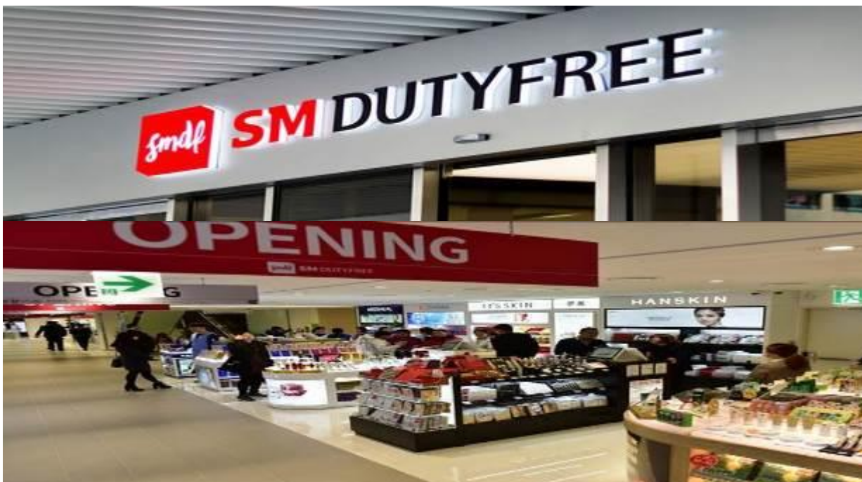
SM DUTY FREE

แล้วพาท่านช้อปปิ้งสินค้าปลอดภาษีที่ SM Duty Free โดยที่นี้มีสินค้าชั้นนำให้ท่านเลือกซื้อ มากกว่า 500 ชนิด อาทิ น้ำหอม เสื้อผ้า เครื่องสำอาง กระเป๋า นาฬิกา ฯลฯ