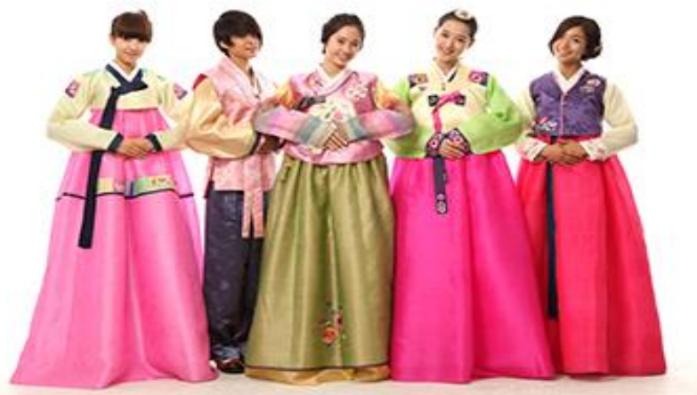
พิพิธภัณฑ์สาหร่าย + ทำคิมบับ + สามชดอันบก