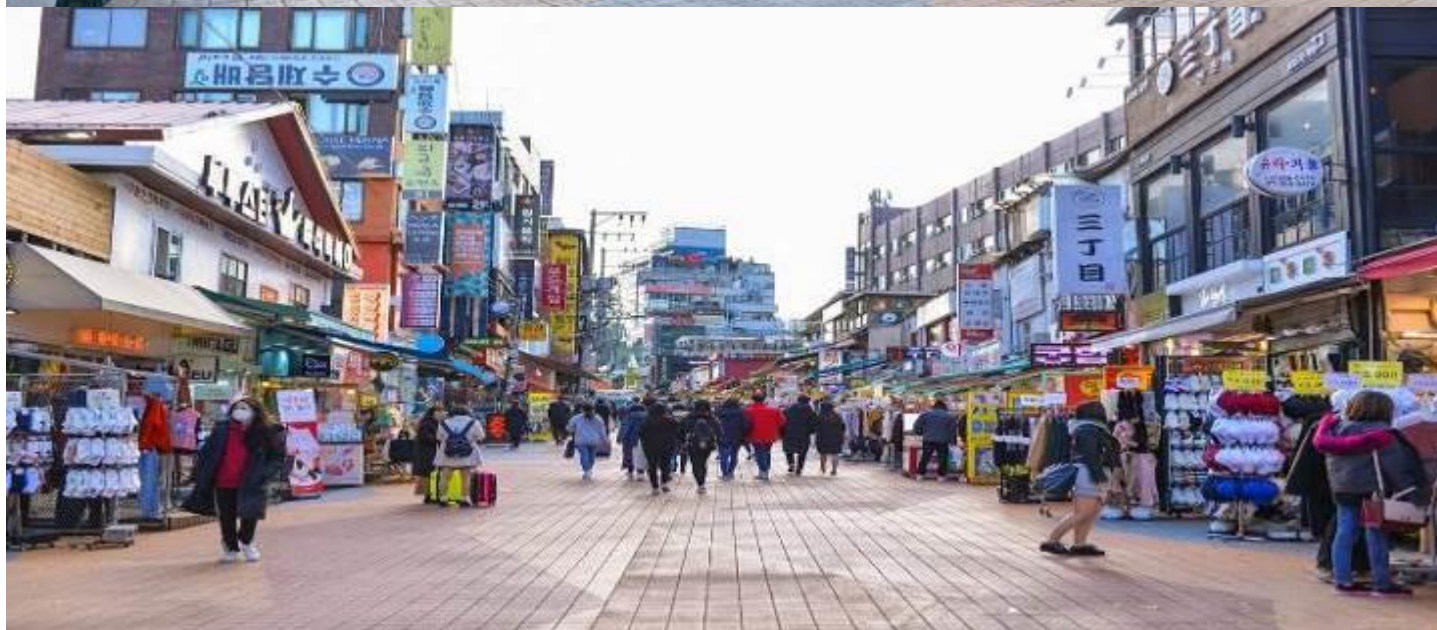
ตลาดองกิก