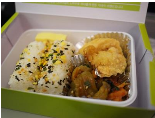
อาหารบนเครื่องบินจินแอร์ซากลับ