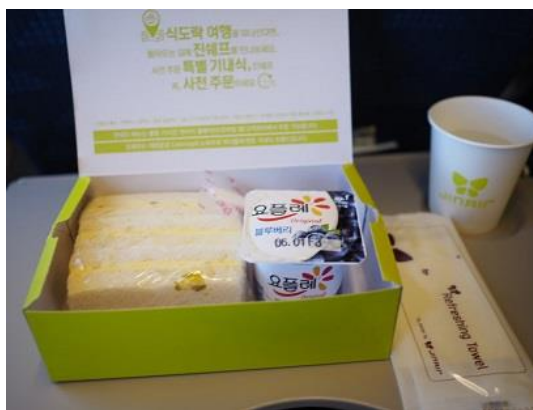
อาหารบนเครื่องบินจินแอร์ขาไป

วันที่ 2 เดินทางถึงสนามบินอินชอน - เกาenamิ - เทศกาลตกปลาน้ำแข็ง - เล่นสกี