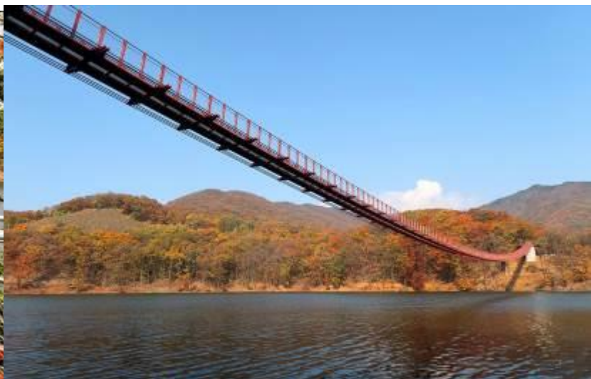
สะพานแขวนมาจังโฮชู

เที่ยง รับประทานอาหารกลางวัน (1) เมนูชาบู ชาบู (สุกี้สไตล์เกาหลี)