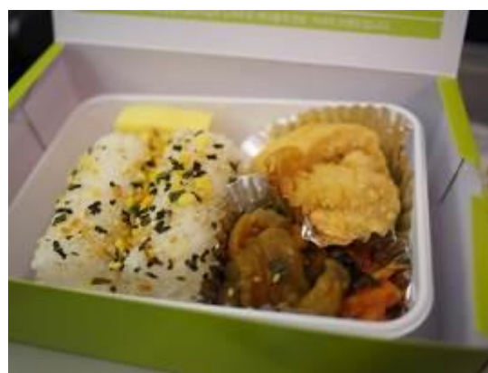
อาหารบนเครื่องบินจินแอร์ซากลับ