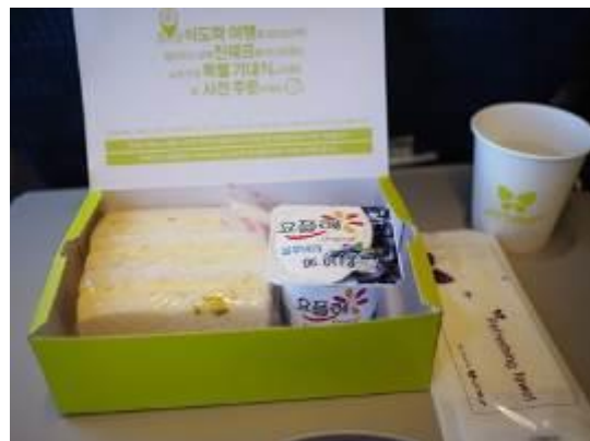
อาหารบนเครื่องบินจินแอร์ฯไป