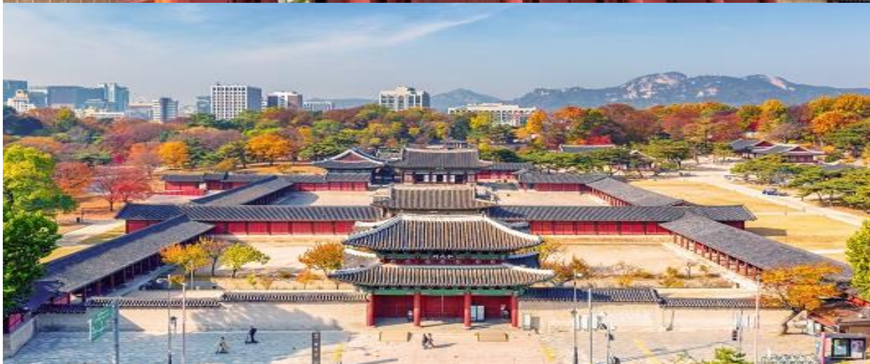
พระราชวังชางด็อกกุง