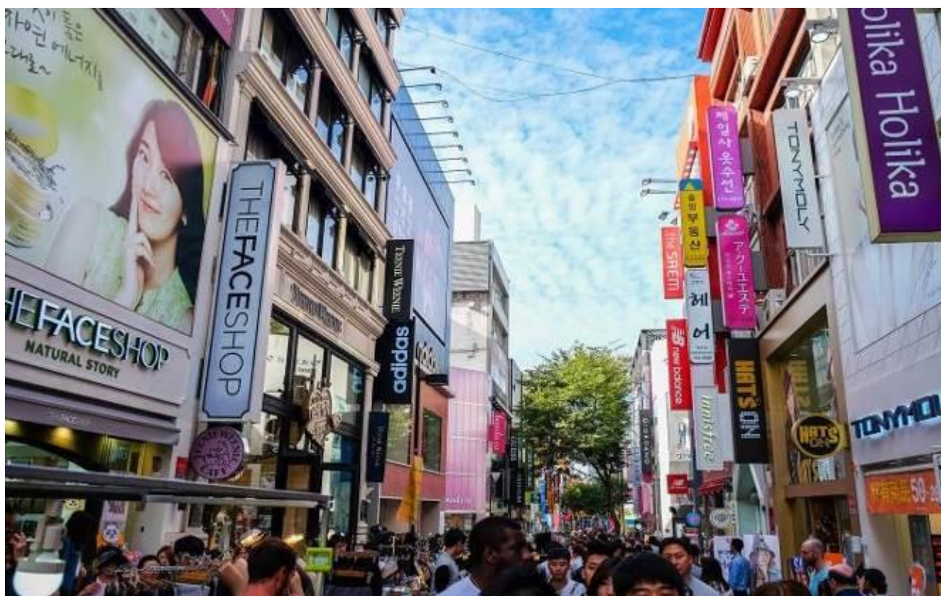
ตลาดเมียงดง

จากนั้นเดินเวลาท่านเดินช้อปปิ้ง ณ ตลาดเมียงดง แหล่งช้อปปิ้งชั้นนำและ สถานที่รวมแฟชั่นชั้นนำของกรุงโซลหรือที่คนไทยรู้จักกันในชื่อสยามแสควร์เกาหลี ท่านจะพบกับสินค้าวัยรุ่นมากมาย หลากหลายยี่ห้อไม่ว่าจะเป็นเครื่องสำอางยี่ห้อดังๆ อย่าง 3CE, SKIN FOOD, THE FACE SHOP, ETUDE HOUSE, MISSHA ฯลฯ เสื้อผ้าแฟชั่นมีสไตล์, รองเท้าแฟชั่นสูงน่ารักๆ, รองเท้าผ้าใบเก๋ๆ, นอกจากนี้ยังมีร้านอาหารและร้านกาแฟน่ารักๆ ซึ่งที่นี่จะมีวัยรุ่น หนุ่มสาวเกาหลีไปรวมตัวกันมากมายในแต่ละวัน