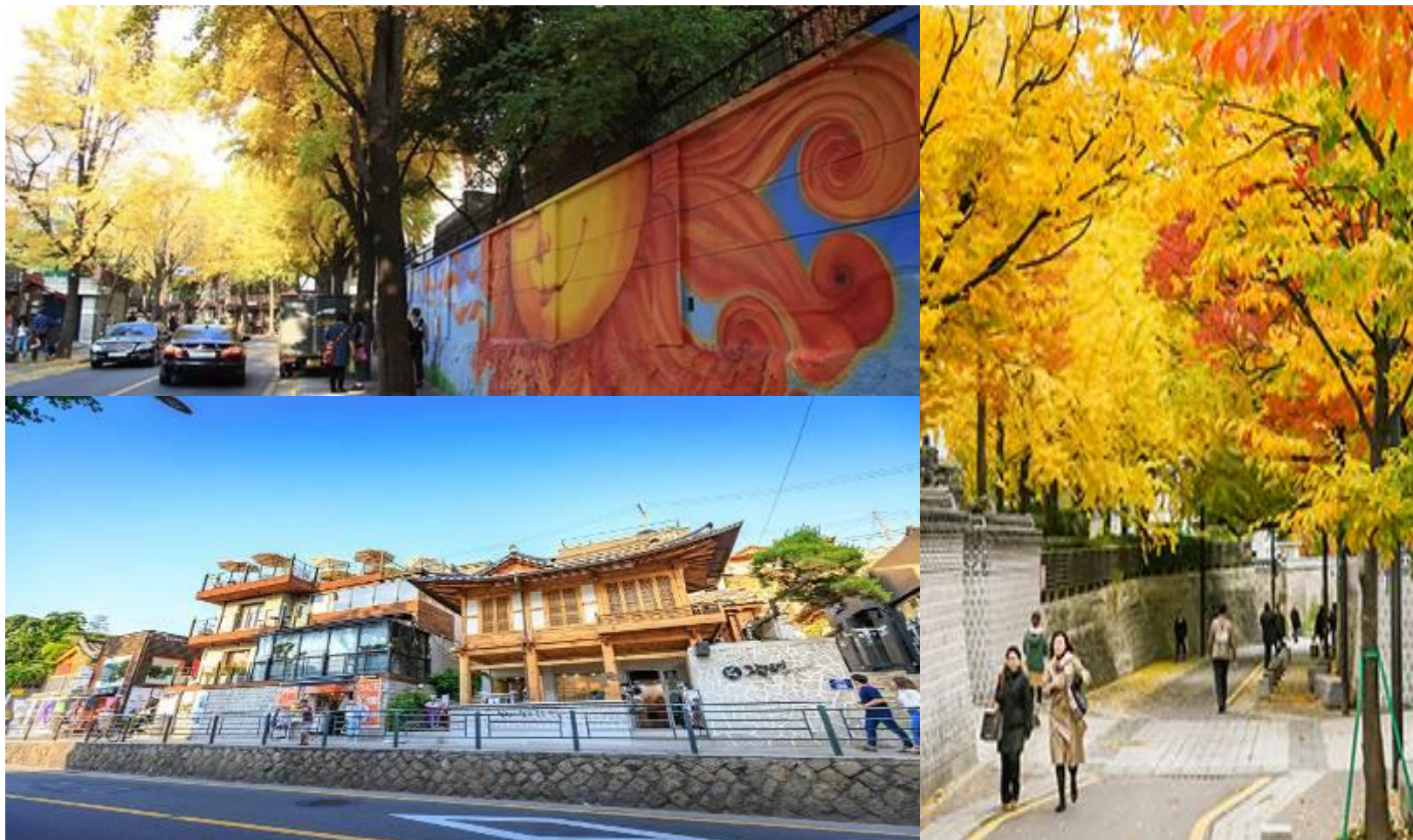
ถนนซัมชองดง

และถ้าพูดถึงถนนที่กำลังฮิตในหมู่วัยรุ่นของกรุงโซลก็คงต้องเป็น ถนนซัมชองดง (SAMCHEONGDONG-GIL) เป็นถนนที่ผสมผสานระหว่างความโบราณและความทันสมัยกันได้อย่างลงตัว โดยบ้านเรือนบางหลังยังคงความโบราณในรูปแบบบ้านเกาหลีโบราณ ฮันอก สไตล์ และมีความทันสมัยโดยการตกแต่งแบบสมัยใหม่มีการระบายสีและตกแต่งทำเป็นร้านค้าสมัยใหม่ แกลอรี่ คาเฟ่เก๋ๆ ตลอดตามแนวกำแพงจะมี STREET ART ตามแนวกำแพง ให้ทุกท่านได้ชื่นชมความงามและสนุกสนานกับการถ่ายรูป เพราะสามารถถ่ายรูปได้ทุกมุม เรียกได้ว่าเดินไม่เบื่อกันเลยทีเดียว หากท่านเดินเล่นจนเหนื่อยแล้วก็หาที่นั่งจิบกาแฟ เป็นร้านคาเฟ่เก๋ๆ ดื่มด่ำความโรแมนติกของบรรยากาศในร้าน ที่ตกแต่งอย่างคลาสสิก และที่ท่านต้องมาที่นี้ในช่วงฤดูใบไม้เปลี่ยนสีนี้เพราะตลอดสองข้างทาง ท่านจะเห็นความงดงามจากใบไม้แดงจากต้นเมเปิ้ลและใบไม้สีเหลืองอร่ามจากต้นแปะก๊วย ซึ่งสวยงามมากจริงๆ