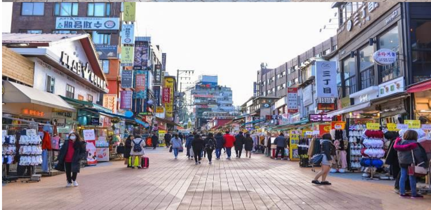
ตลาดของอิก