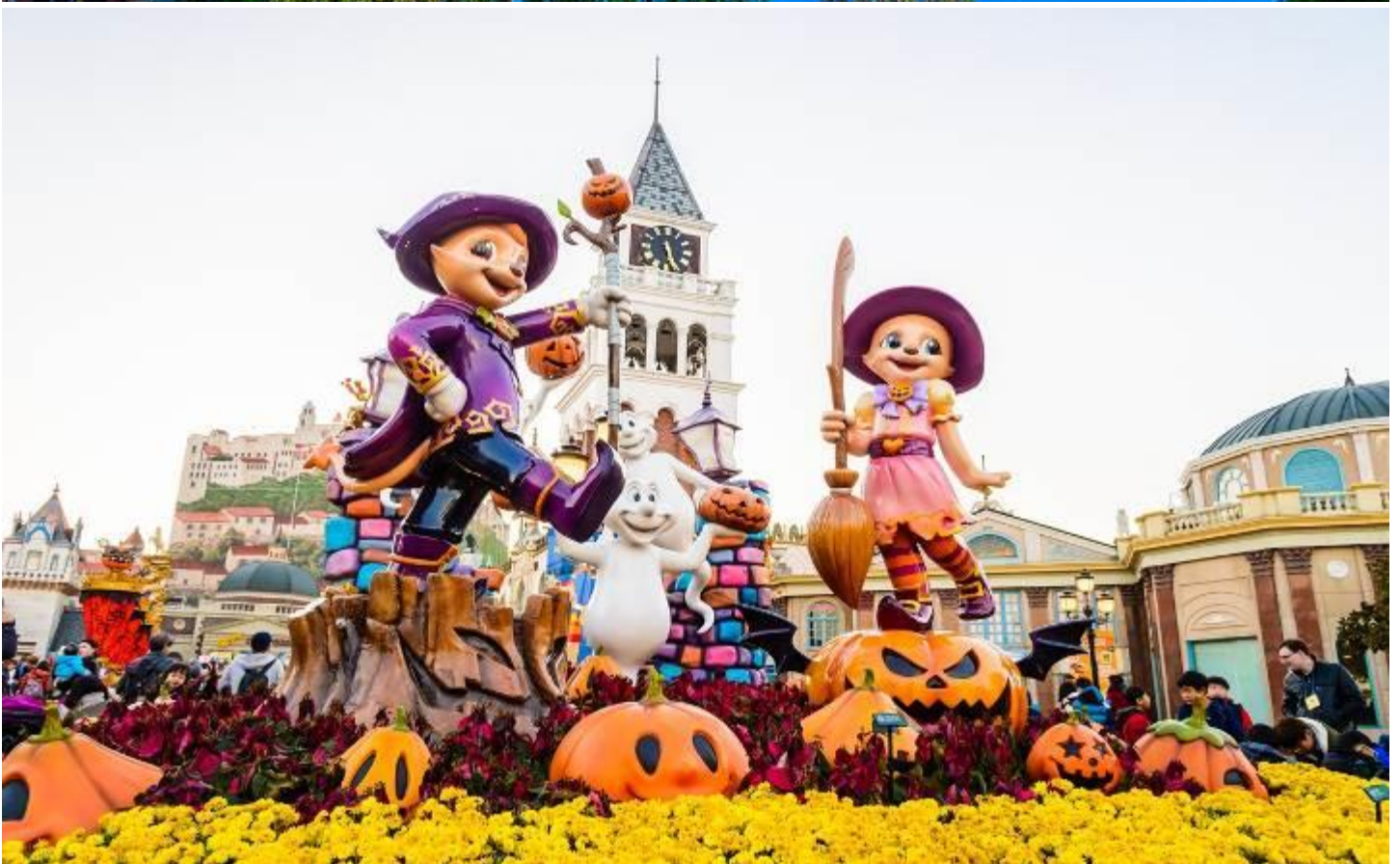
สวนสนุกเอเวอร์แลนด์