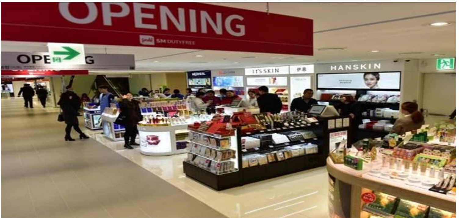
SM Duty Free