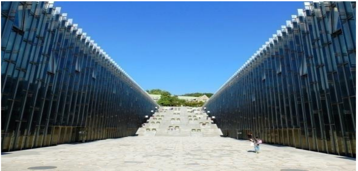
Ewha Womans University