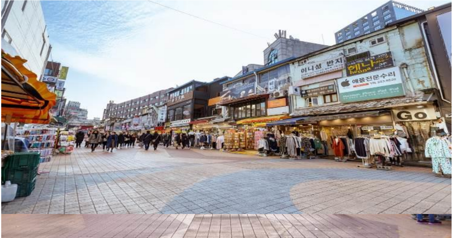
ตลาดฮงอิก

เดินเล่นย่อยอาหารก่อนกลับ ที่ตลาดสุดชิป ตลาดฮงอิก แหล่งช้อปปิ้งที่อยู่ล้อมรอบไปด้วยมหาวิทยาลัยชื่อดังในเกาหลี สินค้าในย่านนี้ ส่วนใหญ่เป็นสินค้าวัยรุ่นที่ทันสมัยและราคาไม่แพงเช่น เสื้อผ้าที่ออกแบบโดยดีไซเนอร์เกาหลีรองเท้ากระเป่า เครื่องประดับ เครื่องสำอาง และยังมีร้านแบรนด์เนมอยู่ทั่วไปเช่น EVISU, ZARA ทุกวันเสาร์ลานหน้าประตูของมหาวิทยาลัยฮงอิก จะมีผลงาน ศิลปะในรูปแบบต่างๆ เช่น เครื่องประดับ ตุ๊กตา เสื้อผ้า และของแฮนด์เมดที่น่ารักและใช้ความคิดสร้างสรรค์ ของบางอย่างทำมาขึ้น เดียวเพื่อให้ได้เลือกซื้อ