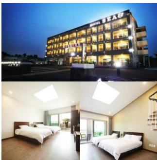
นำเข้าพักที่ Sea & Hotel หรือเทียบเท่า

พร้อมเสิร์ฟด้วยเมนู ซั่มกย็อบซัล เป็นอาหารที่เป็นที่นิยมของชาวเกาหลี โดยการนำหมูสามชั้นไปย่างบนแผ่นโลหะที่ถูกเผาจนร้อน ซั่มกย็อบซัลจะเสิร์ฟพร้อมกับเครื่องเคียงต่างๆ ได้แก่ กิมจิ พริกเขียว กระเทียมหั่นบางๆ พริกไทยป่น เกลือ และน้ำมันงา ถึงแม้ว่าซั่มกย็อบซัลจะมีการเตรียมการที่สุุดแสนจะธรรมดา คือไม่ได้มีการหมักหรือมีส่วนผสมที่หลากหลาย แต่ว่าถ้าพูดถึงรสชาติแล้ว นับว่าพลาดไม่ได้เลย