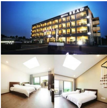
นำเข้าพักที่ Sea & Hotel หรือเทียบเท่า

อาหารเย็น พร้อมเสิร์ฟทุกท่านด้วยเมนู ซีฟู้ดหนึ่ง เมนูปิ้งย่างประกอบไปด้วยหอย และ กุ้ง เกาะเชจูขึ้นชื่อด้วยอาหารทะเลสดๆ อยากให้ทุกท่านได้ลิ้มความหอม หวานของหอย เมนูเสิร์ฟพร้อมข้าวสวยและเครื่องเคียงต่างๆ