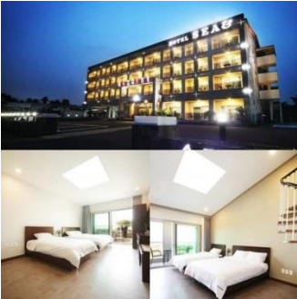
นำเข้าพักที่ Sea & Hotel หรือเทียบเท่า

บางๆ ฟริกไทยป่น เกลือ และน้ำมันงา ถึงแม้ว่าซัมกยอบซัลจะมีการเตรียมการที่สุุดแสนจะธรรมดา คือไม่ได้มีการหมักหรือมีส่วนผสมที่หลากหลาย แต่ว่าถ้าพูดถึงรสชาติแล้ว นับว่าพลาดไม่ได้เลย