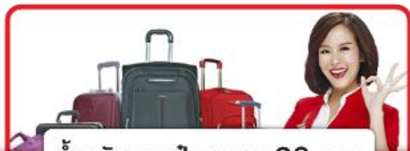
น้ำหนักกระเป๋าสูงสุด 20 ก.ก.

**หากต้องการอัพเกรดที่นั่งรบกวนแจ้งเซลล์ที่ท่านติดต่อเพื่อทำการเช็คที่นั่ง อัตราการให้บริการดังนี้**