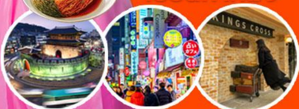
ม็อมปราการฮวาซอง ซ็อบบึงฮ่านเมียงดง King's cross cafe