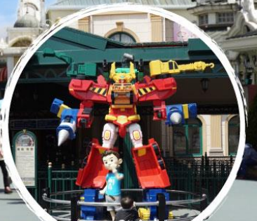
เอเวอร์แลนด์