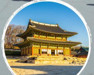
พระราชวังชางก็อกกุง

อินซอน เอเวอร์แลนด์ โซล ทาวเวอร์ คอสเมติก พิพิธภัณฑ์紗紗 + คิมบีบ + 紗紗 ตลาดฮงอ๊ก ศูนย์สนุนโพโซม อมกิส อุนโด พรีเมียม เอ้าเลท ร้านละลายเงินวอน ศูนย์น้ำมันโสมซิมแดง ฮ็อกเกตตามู พระราชวังชางก็อกกุง ทิวทัศน์ ตลาดเมียงดง