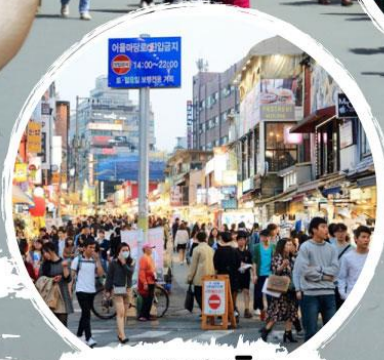
ตลาดฮงอ๊ก