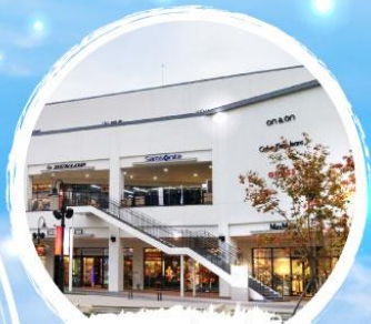
อุนโด พรีเมียม เอ้าเลท