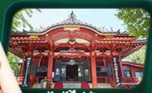
วัดหัวโซเก้่า

พุ่งตัวไปทักทายฟูจิซังแบบเอ็กซ์คลูซีฟ ขึ้นจุดชมวิวชั้น 5 โพสต์ท่าถ่ายรูปคู่สุดปัง ชมเสน่ห์เมืองเก่าคามาคูระ สักการะพระใหญ่โอดบุดสึคามาคูระ ตามรอยซีรีส์ดัง นั่งรถไฟวินเทจ... ชมวิวชวนฝัน สู่เกาะเอโนชิมะ ขอพรด้านความรัก วัดหัวโซเก้่า ห้ามพลาด! โคมไฟยักษ์ วัดอาซากุสะ ปิดท้ายด้วยช้อปปิ้งจุใจในโตเกียว ทักทาย “แมว 3D” ย่านชินจูกุ