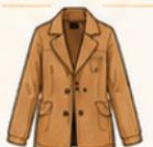
เสื้อแจ็กเก็ต หรือโค้ทตัวยาว