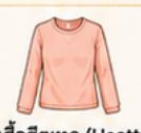
สวมเสื้อฮีทเทค (Heattech) ไว้ด้านในเพื่อเพิ่มความอบอุ่น แทนการใส่เสื้อหนาๆ หลายชั้น