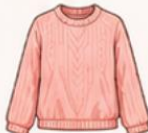
เสื้อสเวตเตอร์ถัก หรือคาร์ดิแกน