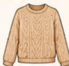
เสื้อไหมพรม