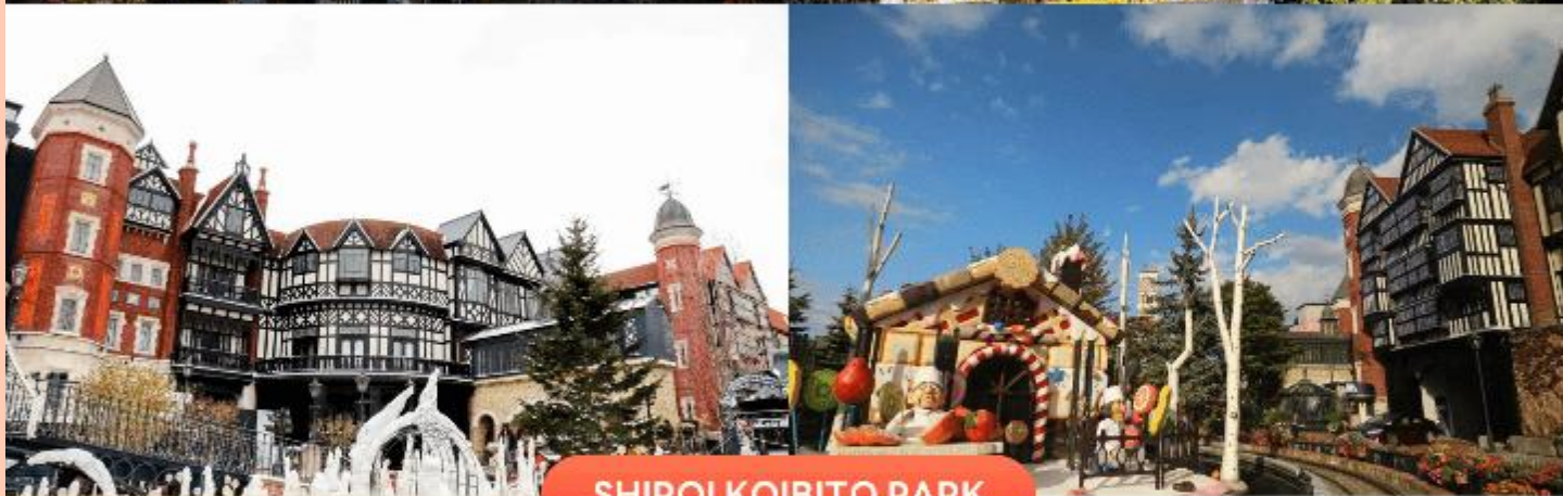
SHIROI KOIBITO PARK