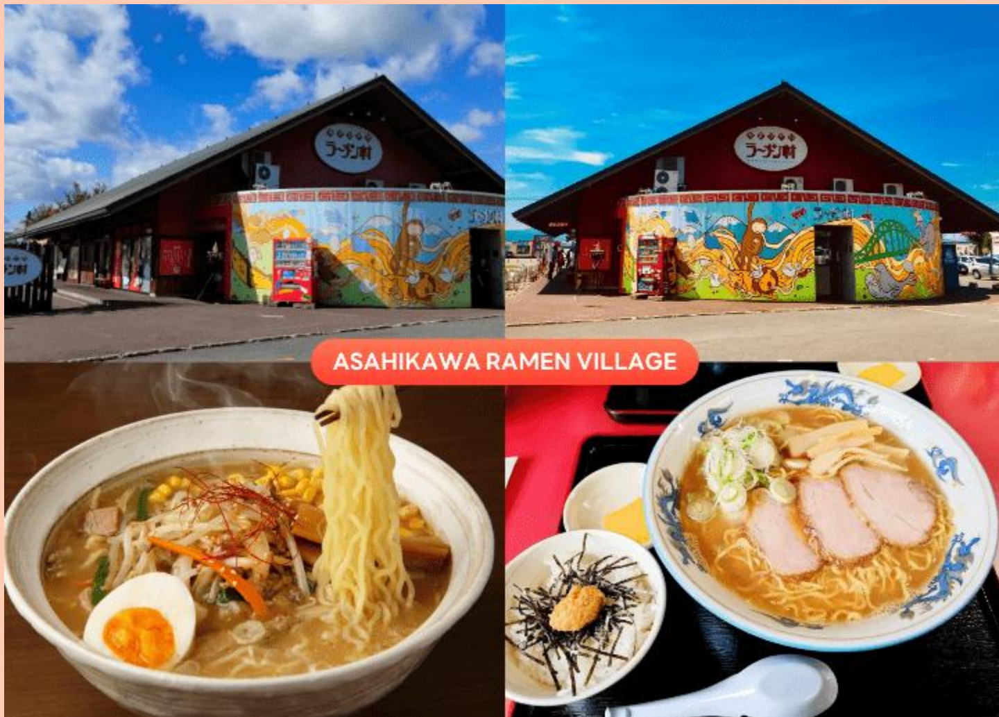
ASAHIKAWA RAMEN VILLAGE

นำท่านเดินทางกลับสู่ เมืองอาซาฮิดาว่า (Asahikawa) เพื่อนำท่านสู่ หมู่บ้านราเมนอาซาฮิดาว่า (Asahikawa Ramen Village) แหล่งรวมราเมนเจ้าดังของเมืองอาซาฮิดาว่า ที่คัดสรรร้านยอดนิยมไว้ถึง 8 ร้านในที่เดียว เพลิดเพลินกับการลิ้มลองราเมนสูตรต้นตำรับฮอกไกโด สไตส์ซูโงยุที่ขึ้นชื่อเรื่องความหอมกลมกล่อม พร้อมเลือกชิมแต่ละร้านได้ตามใจ อีกทั้งยังมีโซนขายของที่ระลึก และพิพิธภัณฑเล็ก ๆ ให้ได้เรียนรู้ประวัติราเมนอีกด้วย