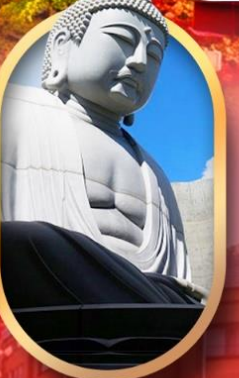
พระใหญ่อะตะมะ