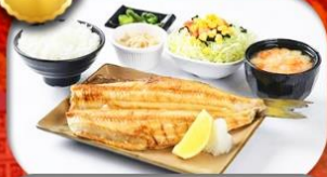
เมนูพิเศษ Set ปลาซอกเกะ