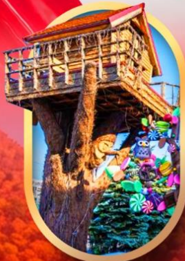
โรงงานช็อคโกแลต