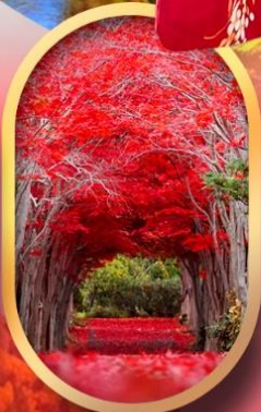
สวนฮิราโอกะ