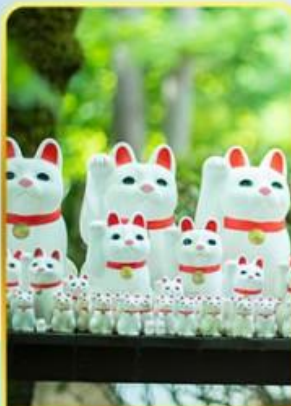
วัดโกโตคุจิ(วัดแมว)