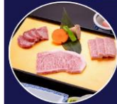
บุฟเฟ่ต์ ซาบุสโด้ลิญี่ปุ่น