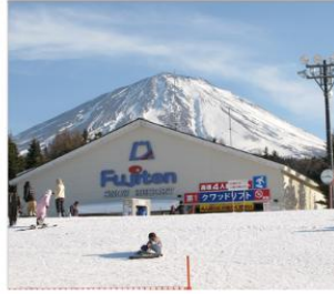
กิจกรรม ณ ลานสกี