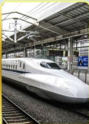
ทดลองนั่งชินคันเซน