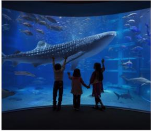
พิพิธภัณฑ์สัตว์น้ำไคยุดัง