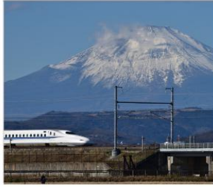
ทดลองนั่งชินคันเซน