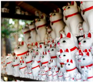
วัดโคโตคุจิ(วัดแมว)