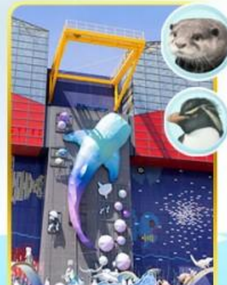
พิพิธภัณฑ์โคยุคัง

🍲 ออนเซ็น 1 คั้น 🧳 น.กระเป๋า 1 ใบ 23 กก. ☀️ 7Days 5Night