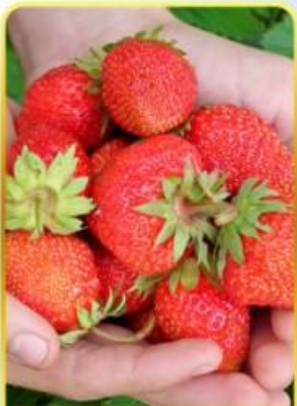
กิจกรรมเก็บสตอเบอร์รี่