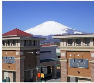
โกเท็มปะเจ้าท์เล็ด