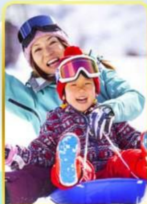
กิจกรรมลานสกีฟูจิ