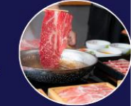
ปิ้งย่างพรีเมียม ROKKASEN เนื้อคุณภาพ