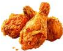
● ไม่ทานสัตว์ปีก (ไก่)