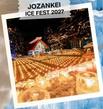
JOZANKEI ICE FEST 2027