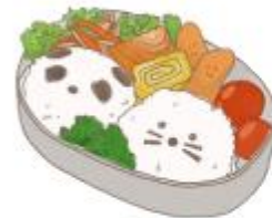
● อาหารสำหรับเด็ก ( 2-11 ปี ) *วัตถุประสงค์ขึ้นอยู่กับทาว์ราน