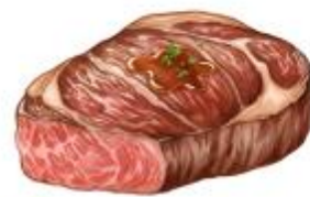
● ไม่ทานเนื้อหมู