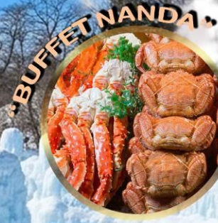
LAKE SHIKOTSU ICE FESTIVAL 2027