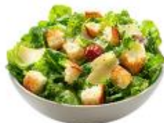
● ผักสดวิธีตี