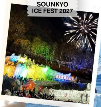
SOUNKYO ICE FEST 2027