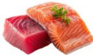
● ไม่ทานปลาดิบ