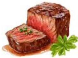
● ไม่ทานเนื้อวัว

ขอความกรุณาแจ้งวัตถุประสงค์ที่ท่าน แพ้หรือไม่สามารถรับประทานได้