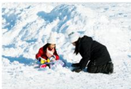
Playing in the snow