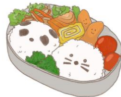
● อาหารสำหรับเด็ก ( 2-11 ปี ) *วัตถุดิบขึ้นอยู่กับทาว์ราน