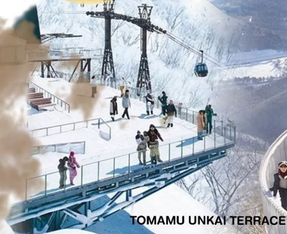
TOMAMU UNKAI TERRACE