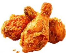
● เนื้อสัตว์ปีก (ไก่)