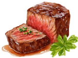
● เนื้อวัว

ขอความกรุณาแจ้งวัตถุดิบที่ท่านแพ้หรือไม่สามารถรับประทานได้