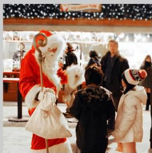
“ODORI GERMAN MARKET”