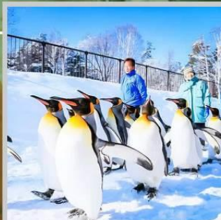
"PENGUIN ASAHIYAMA ZOO"