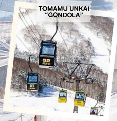
TOMAMU UNKAI “GONDOLA”