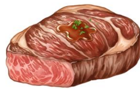
● เนื้อหมู