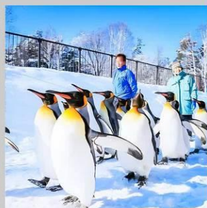
“PENGUIN ASAHIYAMA ZOO”