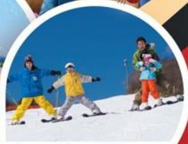
Snow Town Yeti (Free Sled)