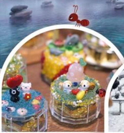
ทดลองทำกล่องดนตรี