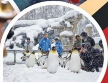
นิกเซ่มารินปาร์ค

ฮิโตเซ่ ◦ โนโบริเบทสึ ◦ ฮาโกดาเตะ ◦ ไทยะ ◦ โฮตารุ ◦ ซัปโปโร