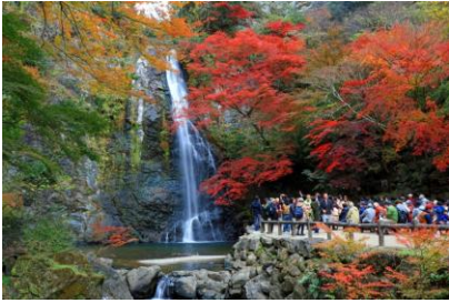
ในจังหวัดโอซาก้า

จากนั้นนำท่านเดินทางสู่ น้ำตกมิโนะ อุทยานธรรมชาติอันงดงามแห่งนี้ทอดยาวครอบคลุมพื้นที่ภูเขาทางตอนเหนือของเมืองมิโนะ ที่ระดับความสูงประมาณ 100 ถึง 600 เมตร น้ำตกมิโนะอันงดงาม กว้าง 5 เมตร สูง 33 เมตร ก่อตัวเป็นหุบเขาที่คดเคี้ยวผ่านผืนป่า และพื้นที่แห่งนี้เป็นที่อยู่อาศัยของพืชพรรณกว่า 980 ชนิด และแมลงกว่า 3,000 สายพันธุ์ ป่าธรรมชาติอันทรงคุณค่า