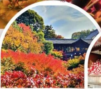
วัดโทฟูคุจิ