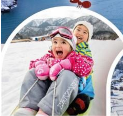
ลานสกี Bokka no Sato