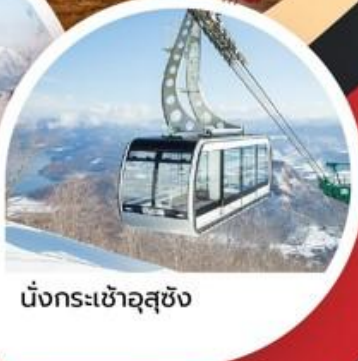
นั่งกระเช้าอุซซัง

ชิโตเซ ◦ โนโบริเบทสึ ◦ โทยะ ◦ โอตารุ ◦ ซัปโปโร