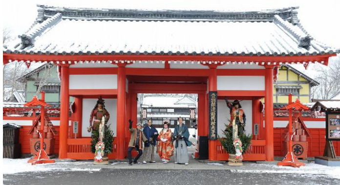
ชามูไร หรือ นินจา

บ่าย นำท่านสู่ หมู่บ้านดาเตะจิโดมูระ เป็นหมู่บ้านที่จำลองวิถีชีวิตของชาวเอโดะในสมัยโบราณ ภายในพื้นที่หมู่บ้าน มีบ้านเมืองที่รายเรียงไปด้วยร้านค้า บ้านชามูไร บ้านนินจา หอสังเกตการณ์ โรงละคร วัด และอื่นๆ อีกมากมาย โดยนักท่องเที่ยวจะสามารถสัมผัสบรรยากาศที่เสมือนอยู่ในยุคญี่ปุ่นโบราณ อีกทั้งนักท่องเที่ยวยังสามารถเช่าชุดกิโมโนจากร้านค้าหน้าหมู่บ้านเพื่อมาถ่ายรูปให้เข้ากับบรรยากาศภายในได้ ซึ่งภายในหมู่บ้านก็จะมีคนแต่งตัวเป็นพ่อค้า