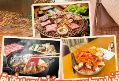
เค็มอิมิ บุฟเฟ่ต์ ซาบู+ซาบูแบบไม่อั้น ปิ้งย่าง Yakiniku Buffet