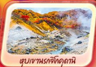
เขมเขานรกโคคุดานิ