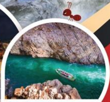
ล่องเรือชมหุบเขาโอโนะ

โทเบ ◦ โทคุชิม่า ◦ ทาคามัตสึ ◦ โคโตะ ◦ มัตสึยาม่า ◦ โอซาก้า