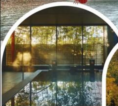
พักโรงแรมระดับ 5 ดาว พร้อมออนเซ็น