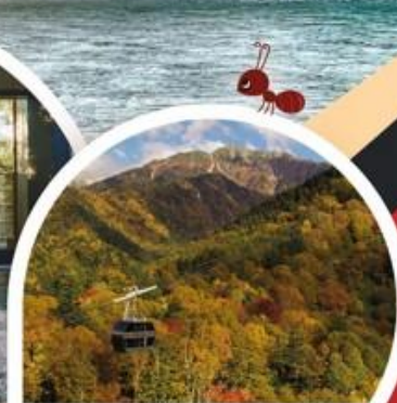
กระเช้าขึ้นโฮตาคะ

นาโงย่า • อิบูยามะ • ทิฟู • ทาคายาม่า • คามิโคจิ • คารุยชิวา • โตเกียว