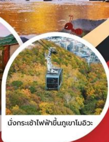
นั่งกระเช้าไฟฟ้าขึ้นภูเขามออิวะ