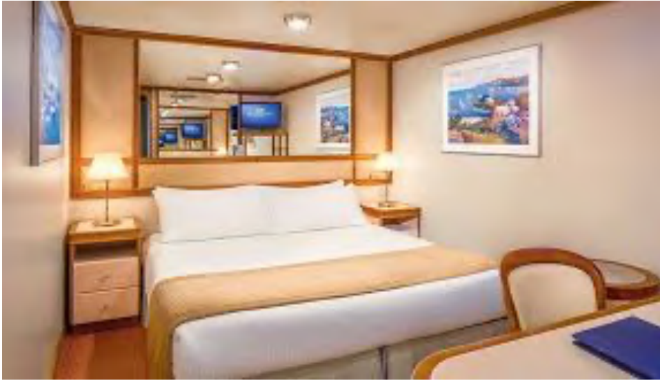
INSIDE ห้องพักแบบไม่มีหน้าต่าง