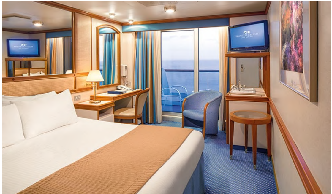
BALCONY ห้องพักแบบมีระเบียง