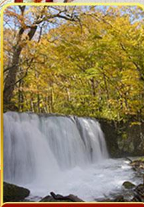
ลำธารโออิราสะ