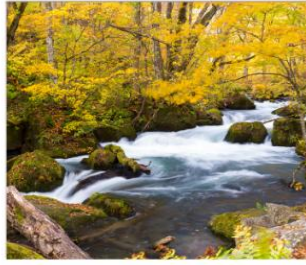
เดินเล่นลำธารโออิราสะ