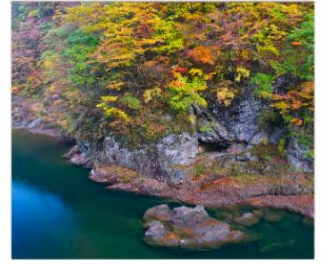
ชมเขาดากิไดริ