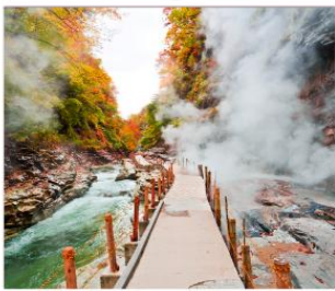
ชมเขาโอยาสึเดียว