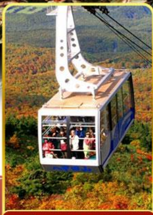
นั่งกระเช้าอากิโตะ