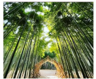
ป่าไผ่วากายามะ