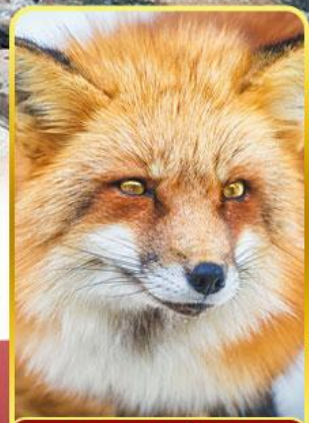
ฟาร์มสุนัขจิ้งจอก