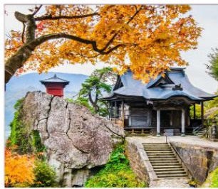
วัดยามาเดระ