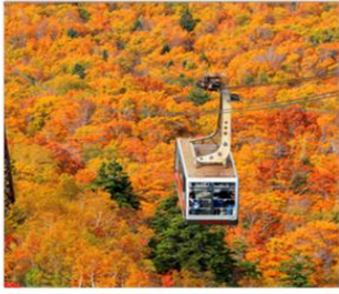
นั่งกระเช้ายักษ์โกดะ