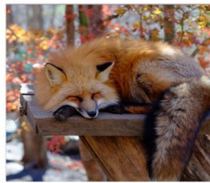
ฟาร์มสุนัขจิ้งจอก