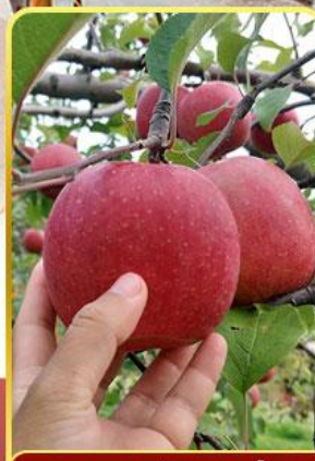
กิจกรรมเก็บแอปเปิล