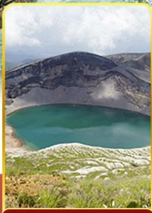
ปากปล่องภูเขาไฟฮาโตะ