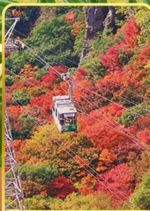
กระเช้าหุบเขาคังคาเคอิ