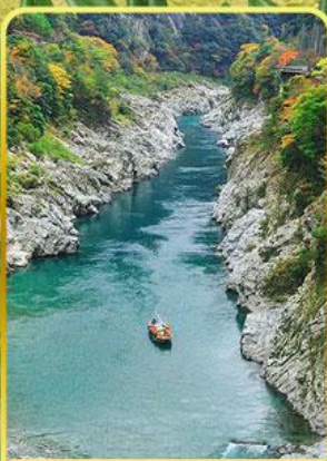
ล่องเรือช่องเขาโอโตะ