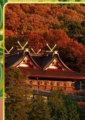
ศาลเจ้าคิมิฮิโตะ