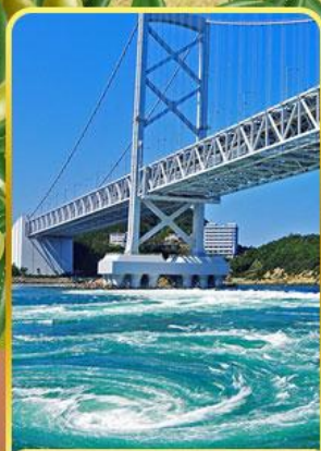
ช่องแคบนารุโตะ