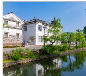
เขตอนุรักษ์เมืองเก่า คุราชิกิ