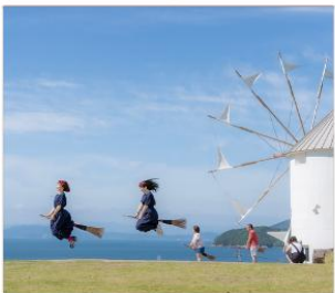
Shodoshima Olive Park เกาะมะกอก