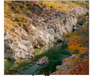
ร่องเรือชม ขุนเขาโอบิโมตะ