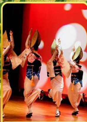
อะวะ โอะโตะริ โคคัง