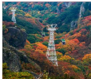
นั่งกระเช้าชมเขา คังดาเคอิ