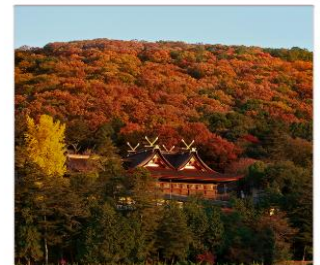
ศาลเจ้าคิมิสิอิโกะ