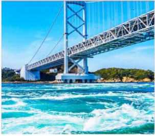
ช่องแคบนารุโตะ