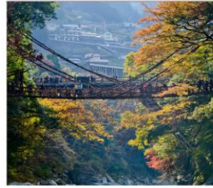
ชมสะพานคะซึระมาชิ