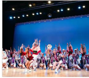
อะวะโอะโตะริไตคัง