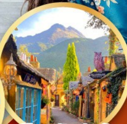
หมู่บ้านยูฟูอิน ฟลอร์ริล