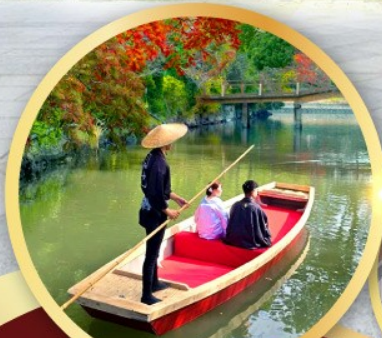
กิจกรรมล่องเรือยามากาวะ