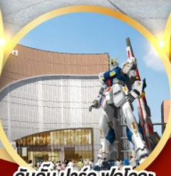
กันดั้ม ปาร์ค ฟุคุโอกะ